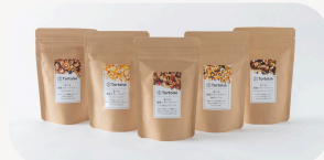
食べる薬膳フルーツティー