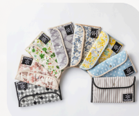
メディカルケース